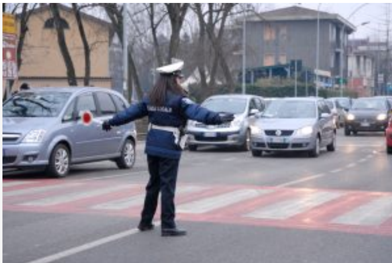
5 novembre 2017 Blocco auto fino a domani a Torino