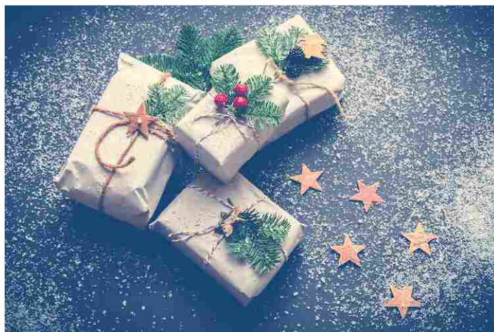
Natale 2021, regali a tema agricolo

Lucine colorate, palline e ghirlande. Se le decorazioni di Natale sono già pronte per essere posizionate, ci si può dedicare a quello che va sotto l'albero: i regali . Da fare e da farsi.