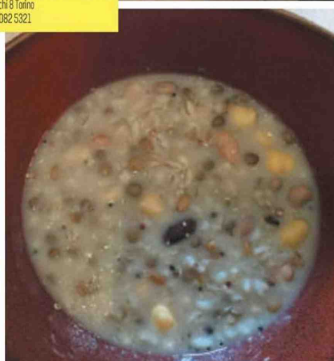
Le sale eleganti del ristorante Le Petites Madeleines all'interno del Turin Hotel Palace. L'insalata con la mozzarella di bufala e la zuppa di legumi e cereali.